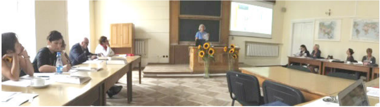
Sesiones de la Comisión de Género en la Conferencia Regional de la UGI “Cambios, retos, responsabilidades”, en Cracovia, Polonia, del 18-22 de agosto del 2014