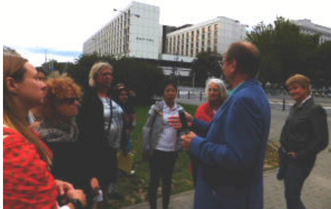
Shirlena Huang (Universidad Nacional de Singapur) Presidenta Comisión de Geografía y Género UGI Noviembre 2014

http://www4.uwm.edu/letsoci/conferences/igu-gender2015/index.cfm .